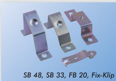
SB 48, SB 33, FB 20, Fix-Klip